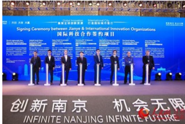
峰会现场，7个国际合作项目正式签约